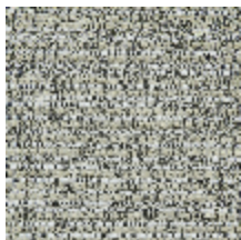
0751-09 MARACAS - SALINES *