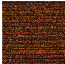
0751-05 MARACAS - SANGUINE *