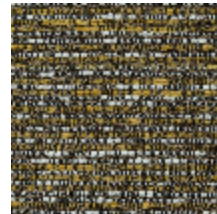
0751-06 MARACAS - TOURNESOL *