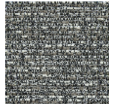
0751-08 MARACAS - CENDRE *