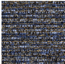
0751-01 MARACAS - BLEUET *