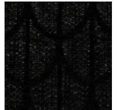
0754-06 PARURE M1 - EBENE