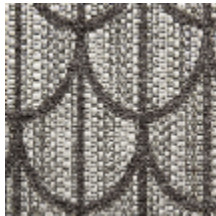
0754-02 PARURE M1 - CENDRE *