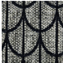
0754-03 PARURE M1 - HERON