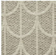
0754-01 PARURE M1 - CYGNE