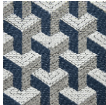
0755-03 CERAMIC M1 - NAUTIQUE