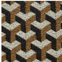
0755-01 CERAMIC M1 - HAVANE