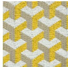
0755-12 CERAMIC M1 - CITRON