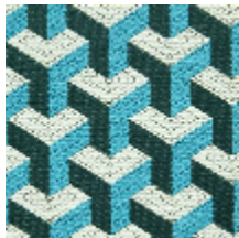
0755-07 CERAMIC M1 - PAON *