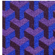
0755-05 CERAMIC M1 - MYRTILLE