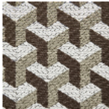
0755-02 CERAMIC M1 - ECORCE