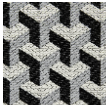
0755-09 CERAMIC M1 - POIVRE