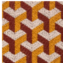
0755-11 CERAMIC M1 - MANGUE