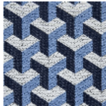
0755-04 CERAMIC M1 - AZUR