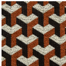
0755-08 CERAMIC M1 - TOMETTE