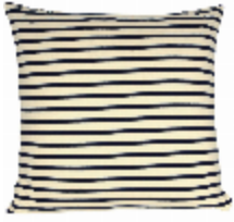
7624-01 COUSSIN MARINIÈRE ECRU/BLEU