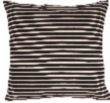
7624-03 COUSSIN MARINIÈRE NOIR/ECRU