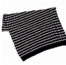
7746-03 PLAID INTEMPOREL NOIR