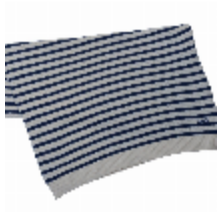
7746-01 PLAID INTEMPOREL BLEU