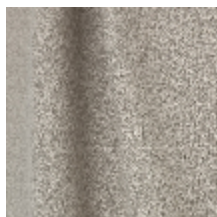
0795-21 DANDY M1 - LIN