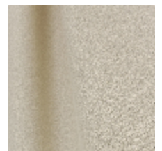
0795-24 DANDY M1 - SABLE