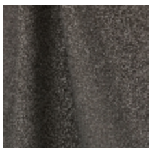
0795-19 DANDY M1 - VISON