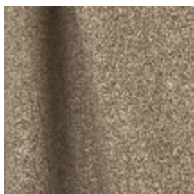
0795-20 DANDY M1 - DUNE