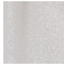
0795-26 DANDY M1 - CRAIE *