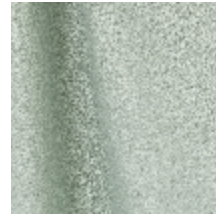
0795-11 DANDY M1 - CELADON