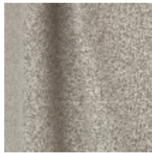
0795-21 DANDY M1 - LIN