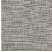
0796-03 PANAMA - FICELLE