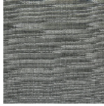
0796-04 PANAMA - SILEX *