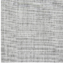
0796-02 PANAMA - PIERRE