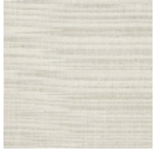
0796-01 PANAMA - CRAIE