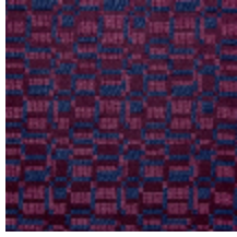
0799-01 KIOSQUE M1 - MYRTILLE