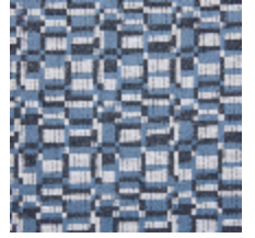
0799-07 KIOSQUE M1 - ARDOISE