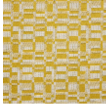
0799-03 KIOSQUE M1 - POLLEN