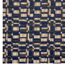
0799-05 KIOSQUE M1 - EBENE