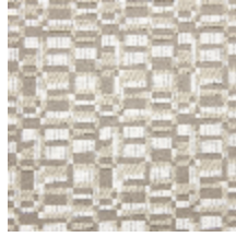
0799-04 KIOSQUE M1 - NATUREL