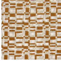
0799-02 KIOSQUE M1 - COGNAC