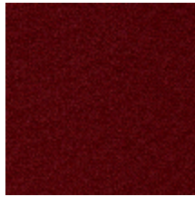
0802-15 LAGO M1 - GRIOTTE