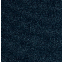
0802-02 LAGO M1 - NUIT