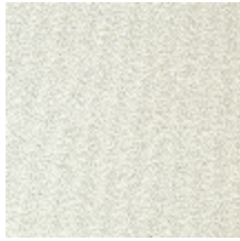
0802-08 LAGO M1 - NEIGE