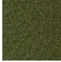
0802-04 LAGO M1 - AMANDE