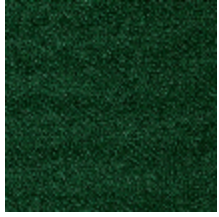
0802-01 LAGO M1 - CANARD