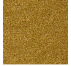
0802-06 LAGO M1 - CURCUMA