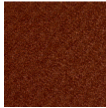
0802-16 LAGO M1 - SANGUINE