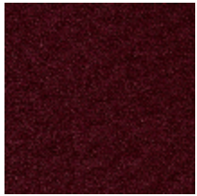
0802-13 LAGO M1 - BORDEAUX