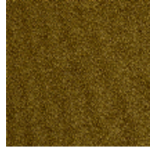
0802-05 LAGO M1 - MOUTARDE