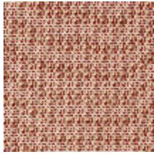
0804-07 DONNA MI - TOMETTE