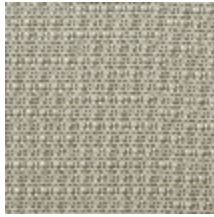
0804-08 DONNA MI - SABLE