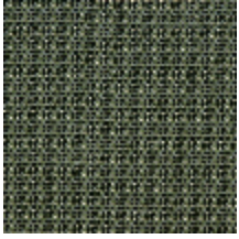
0804-01 DONNA MI - KAKI