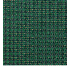
0804-05 DONNA MI - EMERAUDE