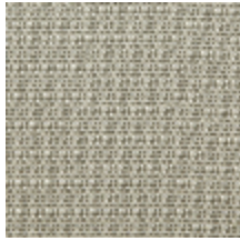
0804-08 DONNA MI - SABLE