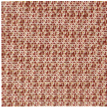
0804-07 DONNA MI - TOMETTE