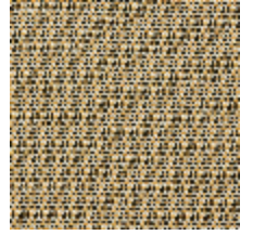
0804-06 DONNA MI - SIENNE