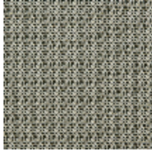
0804-02 DONNA MI - PEPPER