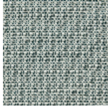
0804-03 DONNA MI - ARDOISE