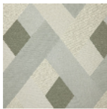
0805-03 SCALA M1 - ARGENT *