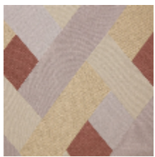
0805-01 SCALA M1 - POUDRE *