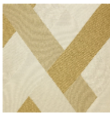
0805-02 SCALA M1 - DORE *