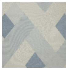
0805-04 SCALA M1 - GLACIER *