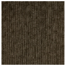
0806-19 RIGA M1 - VISON