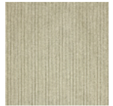
0806-24 RIGA M1 - ALBATRE