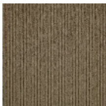
0806-20 RIGA M1 - TAUPE