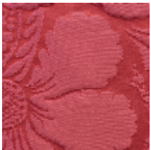
1650-08 VOLANGES- RUBIS