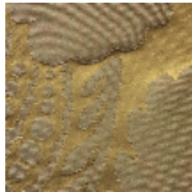
1650-04 VOLANGES- BRONZE *