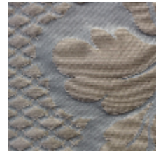
1650-07 VOLANGES- OPALE