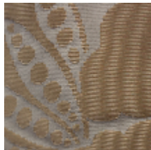
1650-10 VOLANGES-VIEL ARGENT *