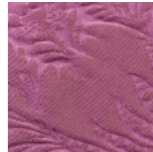
1650-06 VOLANGES- TRAVIATA