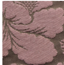
1650-05 VOLANGES-PUCE *