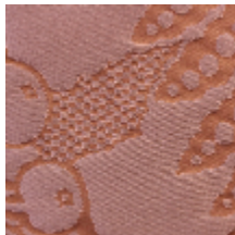
1650-09 VOLANGES- CORNALINE *