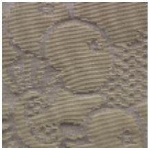
1650-02 VOLANGES- IVOIRE *