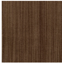
1682-03 VERTIGE - BOIS