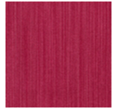
1682-07 VERTIGE - ROSE ANCIEN