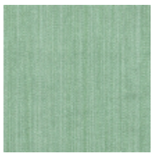
1682-21 VERTIGE - AMANDE