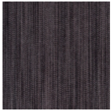
1682-01 VERTIGE - ARDOISE