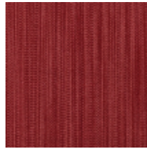
1682-04 VERTIGE - TOURMALINE