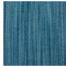
1682-25 VERTIGE - SAPHIR