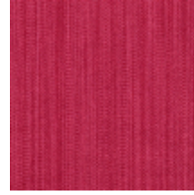
1682-05 VERTIGE - ECARLATE