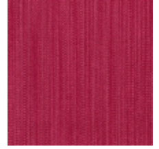
1682-07 VERTIGE - ROSE ANCIEN