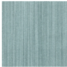
1682-23 VERTIGE - SAUGE