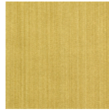
1682-19 VERTIGE - CHARTREUSE