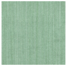
1682-21 VERTIGE - AMANDE