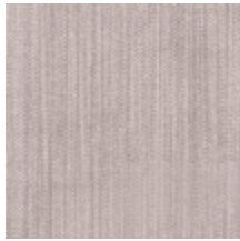
1682-16 VERTIGE - FUMEE *