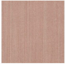
1682-09 VERTIGE - POUDRE