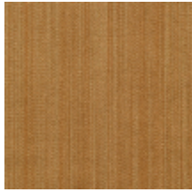
1682-10 VERTIGE - ECAILLE *