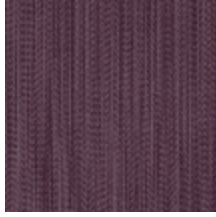
1682-02 VERTIGE - AMETHYSTE