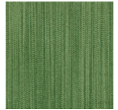
1682-20 VERTIGE - MYRTE