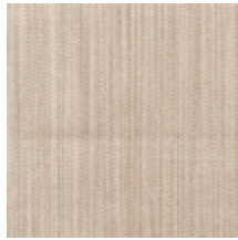
1682-17 VERTIGE - SEIGLE