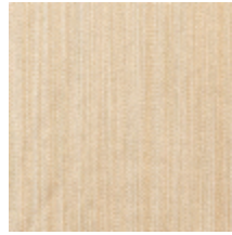
1682-12 VERTIGE - BLOND