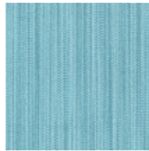
1682-24 VERTIGE - NATTIER