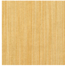
1682-11 VERTIGE - OR