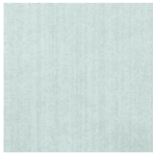
1682-22 VERTIGE - PASTEL