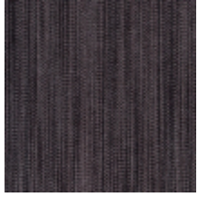
1682-01 VERTIGE - ARDOISE