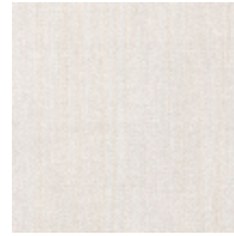
1682-13 VERTIGE - CAMELIA