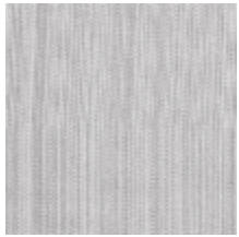
1682-15 VERTIGE - ARGENT