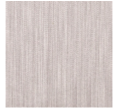
1682-14 VERTIGE - PERLE