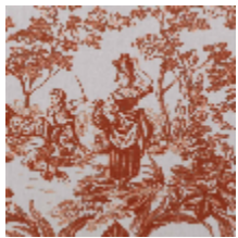
4269-01 BELLE SAISON - TERRACOTTA