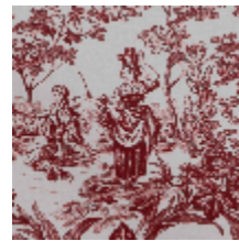
4269-05 BELLE SAISON - GRENAT