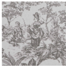
4269-03 BELLE SAISON - CENDRE