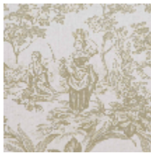
4269-02 BELLE SAISON - TILLEUL