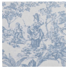
4269-04 BELLE SAISON - FAIENCE