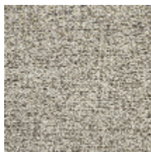
1365-02 VELA - LIN