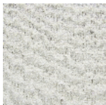
1365-01 VELA - FICELLE