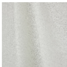
1365-03 VELA - COTON