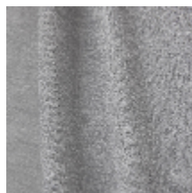
1365-04 VELA - PERLE