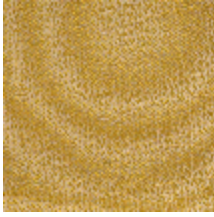
1483-08 SPLASH - SOLEIL *