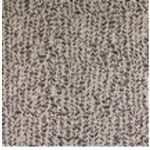
1483-03 SPLASH - GRANITE *