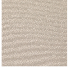
1483-01 SPLASH - NACRE