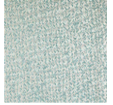
1483-06 SPLASH - ACQUA