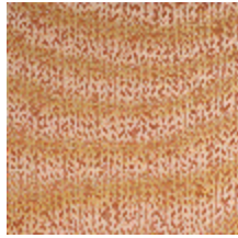
1483-09 SPLASH - PAPAYE