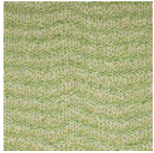
1483-07 SPLASH - PRINTEMPS