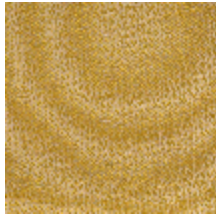
1483-08 SPLASH - SOLEIL