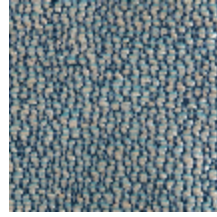
1483-05 SPLASH - OCEAN