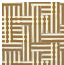
1487-02 NUANCES - TOURTERELLE