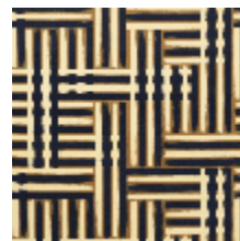
1487-05 NUANCES - CAMEL