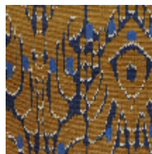
1488-04 IKATI - CAMEL