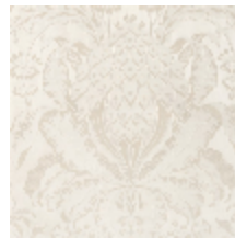
1508-06 LES ANANAS 130CM - NACRE