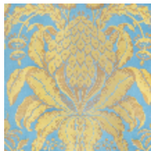
1508-01 LES ANANAS 130CM - BLEU