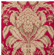
1508-02 LES ANANAS 130CM - CRAMOISI