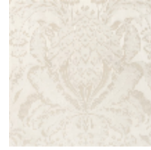
1508-06 LES ANANAS 130CM - NACRE