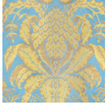
1508-01 LES ANANAS 130CM - BLEU