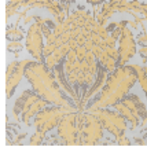
1508-05 LES ANANAS 130CM - OPALE