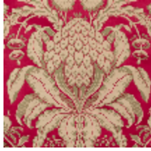
1508-02 LES ANANAS 130CM - CRAMOISI