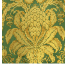
1508-04 LES ANANAS 130CM - VERT