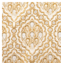
1560-04 LES GRENADES - DORE