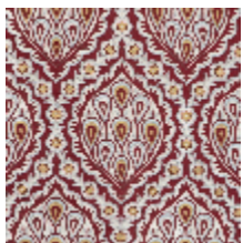
1560-01 LES GRENADES - CRAMOISI