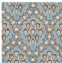
1560-03 LES GRENADES - SAPHIR