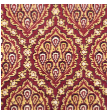
1560-02 LES GRENADES - GRENAT