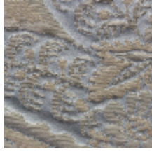
1664-03 TRIANON - NATTIER