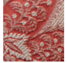
1664-06 TRIANON - ROUX