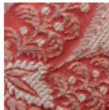
1664-06 TRIANON - ROUX