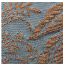
1664-08 TRIANON - BLEU