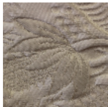
1664-01 TRIANON - IVOIRE