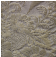
1664-02 TRIANON - PERLE