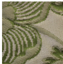
1664-04 TRIANON - VERT