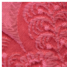
1664-07 TRIANON - RUBIS