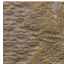
1664-05 TRIANON - OR