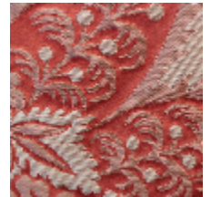
1664-06 TRIANON - ROUX