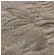
1664-01 TRIANON - IVOIRE