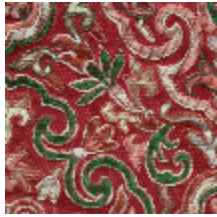
1665-07 GUIMET - RUBIS