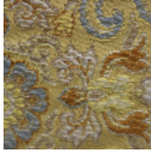
1665-02 GUIMET - OR