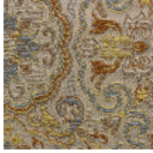
1665-01 GUIMET - IVOIRE