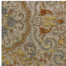
1665-01 GUIMET - IVOIRE