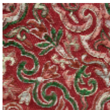
1665-07 GUIMET - RUBIS