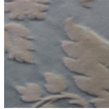
1668-05 GRAND DAUPHIN - JADE