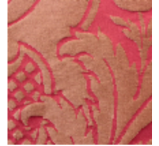
1668-07 GRAND DAUPHIN - ECARLATE