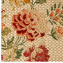
1678-01 POMPADOUR – IVOIRE