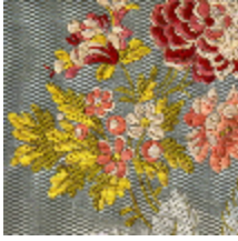
1678-02 POMPADOUR – CELADON