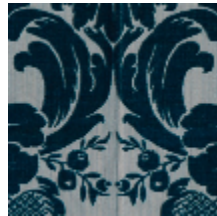
1681-03 MANSART - BLEU