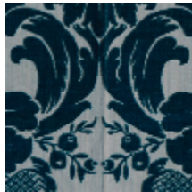
1681-03 MANSART - BLEU