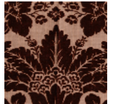
1681-06 MANSART - CHATAIN