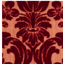
1681-04 MANSART - RUBIS