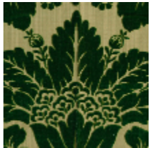
1681-01 MANSART - VERT