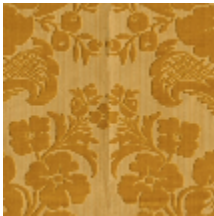
1681-02 MANSART - OR