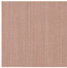
1682-09 VERTIGE - POUDRE