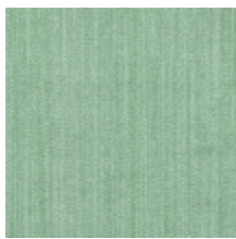
1682-21 VERTIGE - AMANDE