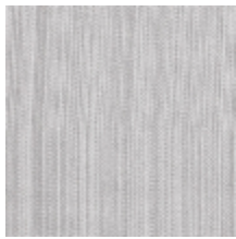
1682-15 VERTIGE - ARGENT