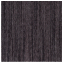
1682-01 VERTIGE - ARDOISE