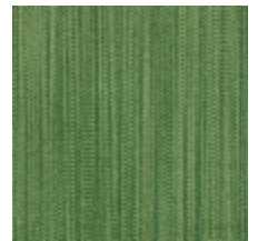
1682-20 VERTIGE - MYRTE