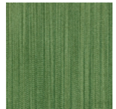
1682-20 VERTIGE - MYRTE