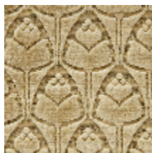
1695-02 TULIPES - OR