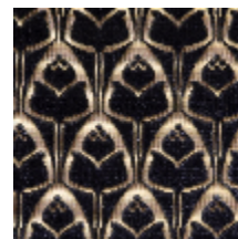
1695-06 TULIPES - ORAGE