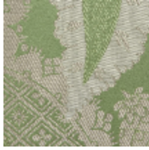
1697-02 PERSIENNE - AMANDE