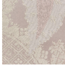
1697-04 PERSIENNE - POUDRE