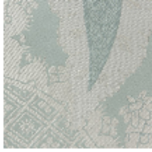
1697-01 PERSIENNE - OPALE