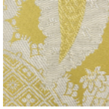
1697-03 PERSIENNE - OR