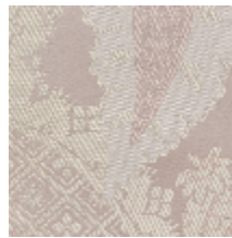
1697-04 PERSIENNE - POUDRE