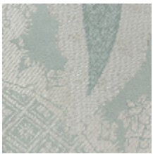
1697-01 PERSIENNE - OPALE