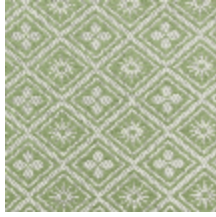
1698-02 CORSET - AMANDE